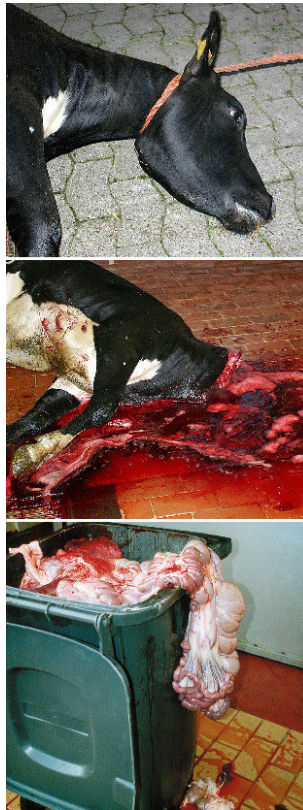
Ein "Untertier" wird zu Nahrungs-, Kleidungs- und Abfallprodukten gemacht.

All die anderen Tiere, die von den Menschen auf vielerlei Weise gefangengehalten, ausgebeutet oder verfolgt werden, nehmen jedoch bewusst wahr, was mit ihnen geschieht und das, was sie wahrnehmen, hat Bedeutung für sie, ganz unabhängig von ihrem Nutzen für andere. Sie streben nach Befriedigung biologischer, sozialer und individueller Bedürfnisse als eine Quelle der Freude und meiden deren Hemmung als Quelle von Schmerz. Sie sind nicht bloß lebendig, sondern besitzen ein eigenes Leben mit bewussten Wahrnehmungen, Gedächtnis, Wünschen, Absichten und Zukunftserwartungen. Um zu erkennen, dass dies keine originär menschlichen Fähigkeiten sind, bedarf es nicht dem Zitieren aus psychologischer und biologischer Forschung. Dies wird jedem spätestens dann klar, wenn er etwa von einem Hund oder einer Katze um Freigang oder gemeinsamen Spielen "angebettelt" wird. Ob menschlich oder nicht, Tiere sind nicht irgendein Etwas, sondern ein Jemand! Und so sehr sich Menschen auch untereinander und Angehörige verschiedener Spezies in vielen Details auch voneinander unterscheiden, so sind sie im Hinblick auf diese grundsätzlich ethisch relevanten Eigenschaften gleich. Daher müssen ihrer Behandlung auch dieselben fundamentalen ethischen Prinzipien zugrunde gelegt werden.