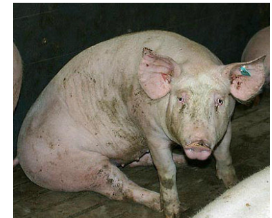
Ein in Gefangenschaft unter Depressionen leidendes Schwein in typ. Trauerhaltung. Der flehende Blickkontakt bleibt ungehört. Speziesisten sehen Schweine nur als willfähige Lustobjekte:

grausame Umstände der Gefangenhaltung als inhuman betrachtet werden. Wer "Leben und Wohlbefinden" n.m. Tiere "sinnlos" mit Füßen tritt, macht sich gemäß deutschem Tierschutzgesetz strafbar. Das gleiche schädigende Verhalten aus so "vernünftigen Gründen" wie Geschmackspräferenzen oder Bequemlichkeit (Konsum von Tierprodukten), Mordlust (Jagd) oder Habgier (Tier-"produktion" und Marktberingung), welchem jährlich allein in Deutschland 500 Millionen Landtiere und ungezählte Fische, die nur in Tonnen erfasst werden, zum Opfer fallen, wird hingegen staatlich gefördert. Der Umstand, dass es schwer fällt, überhaupt noch niedrigere Beweggründe aufzuzählen, verdeutlicht den verlogenen Alibiarakter des Tierschutzes und die Tatsache, dass in der "Tierproduktion" schwersten Leiden und Schäden völlig triviale menschliche Interessen gegenüberstehen. Doch die Frage nach einer gerechten ethischen Berücksichtigung wird zugunsten von persönlichen und wirtschaftlichen Nutzerwägungen ignoriert, andere Tiere bleiben rechtlose Leibeigene und reproduzierbare Bio-Ressource. Der Umgang mit ihnen ist bis heute geprägt vom archaischen Vorrang- und Nutzdenken des Stärkeren, in dem der Zweck die Mittel heiligt, nur offen eingestehen möchte man das nicht mehr.