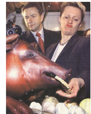
Ex. Ministerin Künast demonstriert Tierschutz