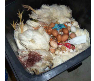
Vegetarische Realitäten

"Milch"kühe hingegen sind Qualzuchtungen, die unter ständiger Wegnahme ca. 300 Eier bzw. durch permanent erzwungene Schwangerschaft bis zu 10000 l Muttermilch pro Jahr "produzieren". Diese abnorme "Leistung" können sie nur über einen Bruchteil ihrer natürlichen Lebenserwartung aufrechterhalten und werden dann umgebracht. Von den Kindern, die Kühe jedes Jahr bekommen oder vielmehr verlieren, landen die männlichen nach kurzer Mast in der Schlachtung. Die männlichen Küken aus der "Lege"hennenzucht werden unmittelbar nach dem Schlüpfen zerhackt oder vergast. Die speziesistische Praxis der Beraubung und Verzweckung individuellen Lebens zum Zweck wirtschaftlicher Produktion ist zwangsläufig mit Quälerei und Tötung verbunden.